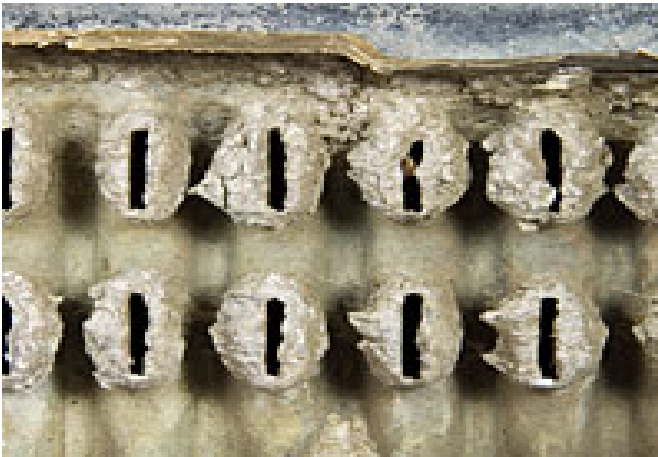
*Kerak pada Radiator

Pada umumnya “OVER HEATING” disebabkan oleh Kerak (Scale) dan Karat didalam Radiator, Mesin & Heater .