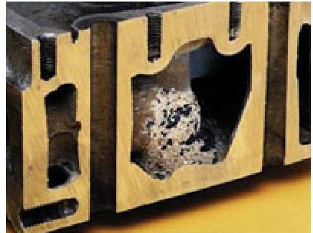
*Kerak & Karat dalam Mesin